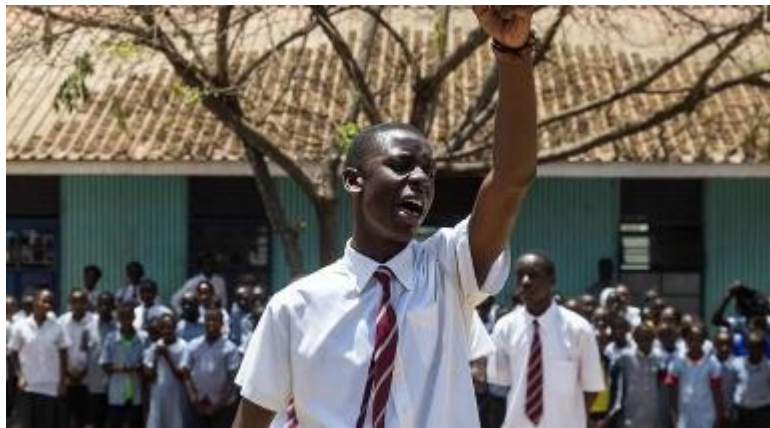
Una scena del film 'The sky over Kibera' di Marco Martinelli

'The sky over Kibera' fa parte della rassegna 'Il cinema della verità', dedicata ai film del regista Marco Martinelli. Ingresso gratuito. Per informazioni chiamare lo 0546-21306 o consultare il sito www.accademiaperduta.it .