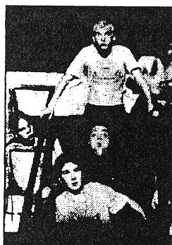
"Baldus" in scena nei sotterranei del Valle

Con Baldus - in scena nei sotterranei del Valle da domani al 3 marzo - il Teatro delle Albe si cimenta nella prima fase del progetto "Cantiere Orlando", promosso dalla Biennale di Venezia. Un cantiere che, come dice il nome, fa dei romanzi cavallereschi e rimasimentali il proprio standard.