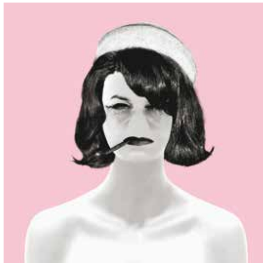
grafica Albertina Lupari De Fonseca

intero 12€ | ridotto 10€ | under30 e over65 8€ | partecipanti non-scuola e MEME 5€